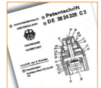
Patentschrift: Benkiser 2-Mengen-Spülung Patent specification: Benkiser dual flush system

Förderung verlegt Benkiser die Produktion in den Neubau nach Burglengenfeld / Bayern. Under the border-zone development programme Benkiser moves its production to a new factory in Burglengenfeld / Bavaria. 1975 - Das Kaiserreich Persien ist der wichtigste Export-Markt. Und die Armaturen werden bunt: Rot, Weiß und Ocker sind die Trendfarben. Förderung verlegt Benkiser die Produktion in den Neubau nach Burglengenfeld / Bayern. Under the border-zone development programme Benkiser moves its production to a new factory in Burglengenfeld / Bavaria. 1975 - Das Kaiserreich Persien ist der wichtigste Export-Markt. Und die Armaturen werden bunt: Rot, Weiß und Ocker sind die Trendfarben.