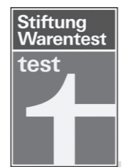
Testsieger Benkiser! Benkiser comes top in the test!

1975 - The Kingdom of Persia becomes the most important export market. And the fittings become colourful: red, white and ochre are the most popular colours. Wasser wird kostbar. Die Entwickler von Benkiser erkennen frühzeitig den Trend zur wassersparenden 2-Mengen-Spülung. Ein technisches Meisterwerk. As water becomes valuable, Benkiser's designers are among the first to recognise the trend towards watersaving dual flush systems. A technical masterpiece. 1998 - Test! Erstmals prüft die deutsche Stiftung Warentest die Leistungsfähigkeit von Druckspülern und der Benkiser „Twimat“ wird mit der Note 2,2 zum Besten seiner Klasse gewählt. Qualität überzeugt.