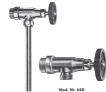
1954: Benkiser Eckventile mit Handrad 1954: Benkiser angle valves with hand wheel

1965 - The economic miracle happens and smart advertising staff come up with "Benki" - Benkiser's attractive advertising character that matches the spirit of other cartoon characters used in advertising. Im Rahmen der Zonenrand