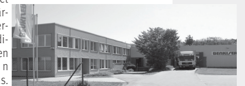
Geschafft! Das Benkiser Werk wieder flottgemacht. Done! The Benkiser plant gets going once more.

2012-2017 Benkiser stattet die öffentlichen Sanitär-Räume der Pilger-Stadt Mekka in Saudi-Arabien mit tausenden WC-Druckspülern Art. 890 aus. 2012 - 2017 Benkiser provided thousands of WC flush valves art. 890 for the public sanitary rooms of the Muslim pilgrim city Mekka in Saudi-Arabia.