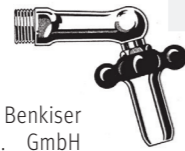
Patent 1909: Der Benkiser Auslaufhahn mit Selbstschluss-Ventil The first patent of 1909: the Benkiser drainage tap with self closing valve.

recovery the "Roland flush" is a genuine turning point in Benkiser's development. The "Roland" makes it possible for the company to mass-produce and opens up new markets. Im II. Weltkrieg wird Kupfer knapp und Benkiser muss seine Hebelspüler aus Zinkdruckguss fertigen. In the Second World War copper is in short supply and Benkiser is forced to make WC lever valves out of die-cast zinc.