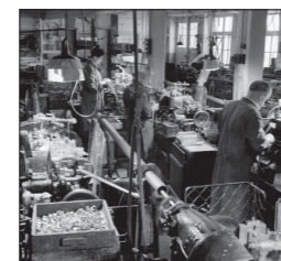
Die industrielle Fertigung läuft auf Hochtouren Industrial production runs at full capacity